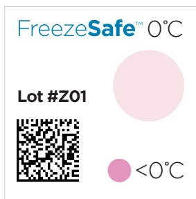
Exposición menor al tiempo de activación